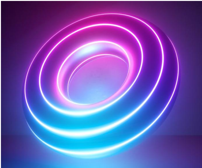
Figura 3: Forma del Universo